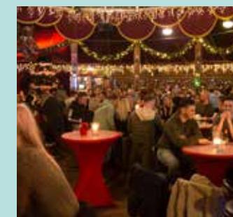
Spiegeltent (tot 250 personen)

Een unieke setting uit de Rocky Mountains met veel hout, Chesterfield banken, open haard en winterse gezelligheid.