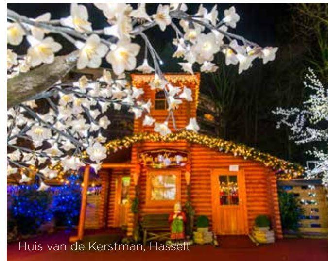
Huis van de Kerstman, Hasselt

Het Huis van de Kerstman staat op een centrale plek op het Kolonel Dusartplein en wordt ingericht alsof de Kerstman en zijn elfjes er wonen en werken. Het beschikt over diverse kamers, waaronder een postkamer, een keuken en een werkkamer.