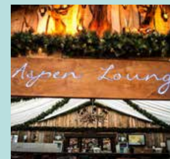
Aspen Lounge (tot 100 personen)

Ontdek het Grand Café van Winterland Hasselt. Een Gezellige en sfeervolle ruimte in een winterse decoratie.