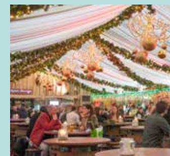
Grand Cafe (tot 400 personen)

Winterland Hasselt biedt tal van mogelijkheden om een bedrijfsevent of eindejaarsfeest te organiseren in een ongedwongen wintersfeer. Op 4 verschillende locaties heerst een gezellige winterambiance en wordt iedereen ondergedompeld in een land waarin beleving centraal staat. Er zijn diverse mogelijkheden op vlak van catering en attracties. Informeer naar de mogelijkheden! Mail naar info@winterland.be of bel +32 (0)473 710779.