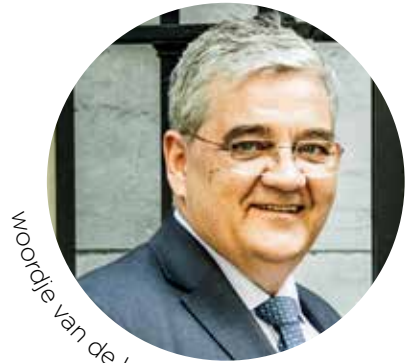
Wording van de burgemeester